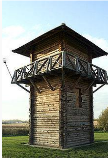
Replica van een Romeinse wachttoren bij Fort bij Vechten

Bij de aanleg van het fort en in de directe omgeving ervan zijn Romeinse overblijfselen gevonden.