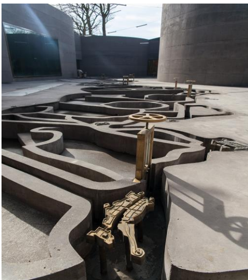
maquette Nieuwe Hollandse waterlinie

Op een toegangsweg is een hedendaagse gedenksteen aan de toenmalige Romeinse grens (limes) geplaatst.