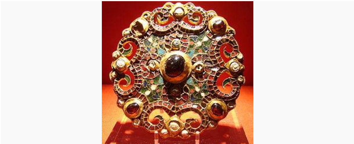
Fibula van Dorestad uit circa 775-800 gevonden in een waterput van Dorestad.

Tijdens de Romeinse tijd bevond zich hier aan de Rijn een Romeins castellum, wellicht Levefanum. Ook liep de noordelijke grens (limes) van het Romeinse Rijk dwars door Wijk bij Duurstede.