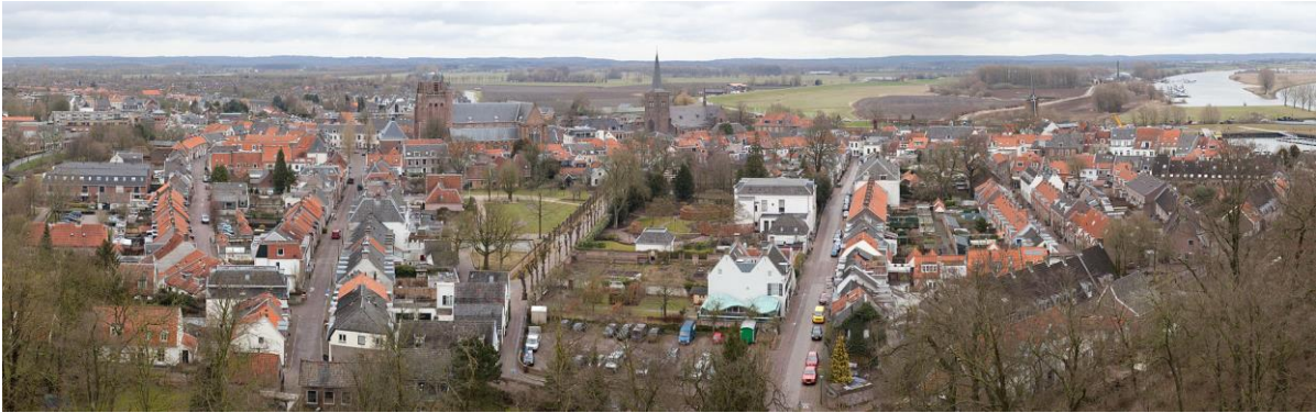
Zicht op Wijk bij Duurstede

Voor het naamdeel Wijk worden verschillende verklaringen gegeven, zoals dat het onder meer herleid zou kunnen worden tot het Romeinse vicus, of het Germaanse wik wat weer "bocht" of "inham" betekent. Het naamdeel Duurstede laat zich herleiden tot de vroegere handelsplaats Dorestad, welke naam op zijn minst deels van Keltische oorsprong is.