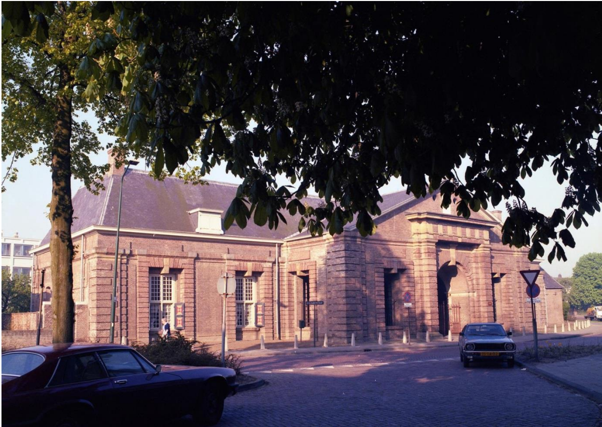
het Graafs Museum