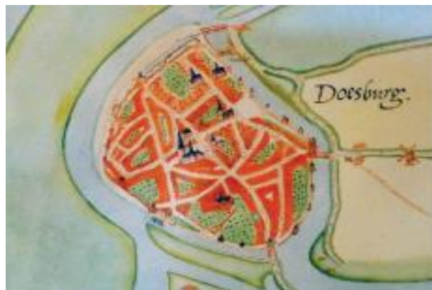
Stadsplattegrond Doesburg uit 1565 (* is Ooipoortkerk)

Door de kerstening vanuit Rome ontstaan in de 7e eeuw kerkgebouwen in ons land. Ook in Doesburg worden in de middeleeuwen kerken en kloosters gebouwd. Op een stadsplattegrond van Jacob van Deventer (1565) zijn die mooi