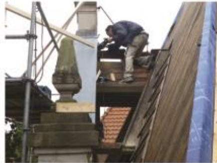
13. Slechte bouwdelen worden vervangen

De provincie Gelderland verstrekt in het kader van 'Herbestemming van Industrieel / Religieus Erfgoed' een subsidie van ± € 125.000,-.