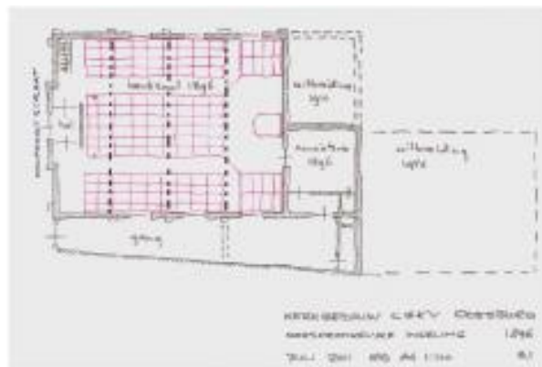
Indeling kerkzaal 1896

In 1954 wordt de kerkzaal daadwerkelijk uitgebreid met een liturgisch centrum. Bij deze ingreep ontstaat de triomfboog tussen beide ruimten. De kapconstructie en het houten gewelf van de kerkzaal worden aan het oog onttrokken door een verlaagd zachtboardplafond. Verder wordt een nieuwe consistorie gebouwd achter de kerkzaal. Op den duur wordt de kerk te klein voor de Gereformeerden.