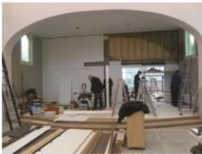
19. Opbouw aandachtwand met kruis