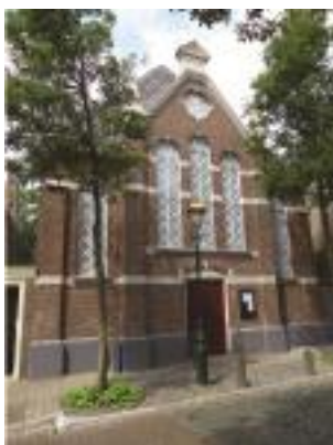
Voorgevel na oplevering in 2016

De bakstenen voorgevel is gebouwd in sobere neo-renaisance-stijl. Het verhoogde midden geveldeel (risaliet) wordt geflankeerd door twee lagere geveldelen. In deze risaliet is de hoofdtoegang tot het pand opgenomen. De gevel staat op een gepleisterde plint en is voorzien van een 3-tal gepleisterde speklagen. De risaliet wordt links en rechts geaccentueerd door een gemetselde pilaster, die worden bekroond met dekstenen en een pinakel.