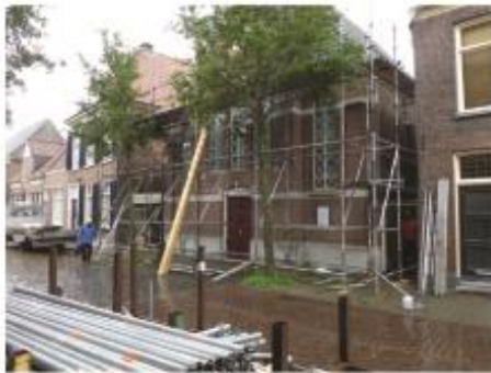
10. Start restauratie in 2015