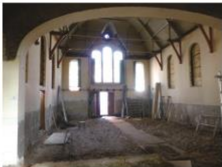
12. Een lege kerk, na sloop van het interieur uit 1971