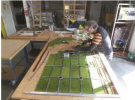
17. De glazenier aan het werk (oude glaasjes, nieuw loodwerk)

In 2014 wordt het renovatieplan definitief gemaakt met bestek en tekeningen en gecompleteerd met adviezen op het gebied van techniek, bouwfysica, akoestiek en verlichting.