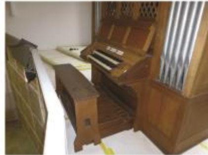
22. Het pijporgel (1960) krijgt een plek op de orgelgalerij