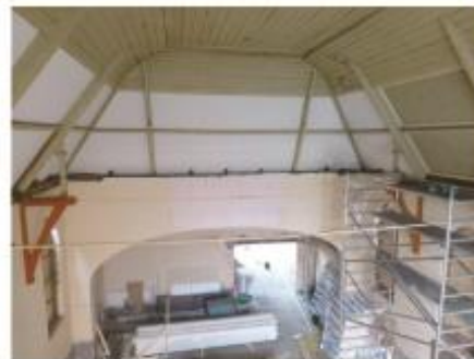
16 Het oude houten gewelf is er weer