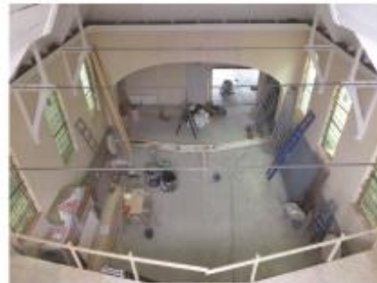
15. De kerkzaal krijgt vorm