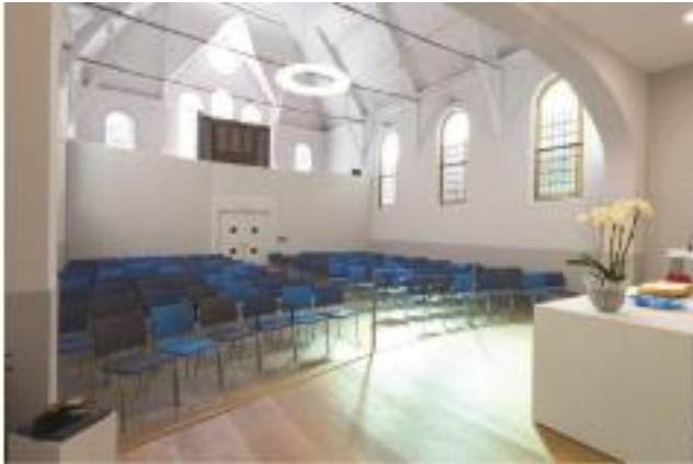
Kerkinterieur na de restauratie

Achter de dubbele voordeur bevindt zich de hal met garderobe, toiletten en een trap naar de galerij.