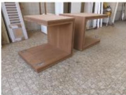
20. Tafels liturgisch centrum, gemaakt van de oude kerkbanken