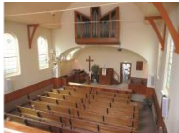
Kerkinterieur van 1971 tot 2014

In 2015-2016 ondergaat de kerk een totale restauratie en herinrichting. De officiële heropening vindt plaats op 4 en 5 juni 2016.