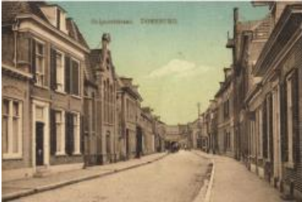
Ooipoortstraat met Ooipoortkerk rond 1900