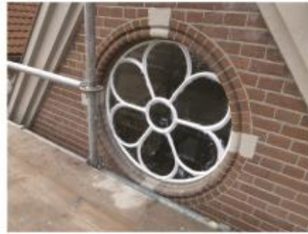
14. Het ijzeren roosvenster is weer terug