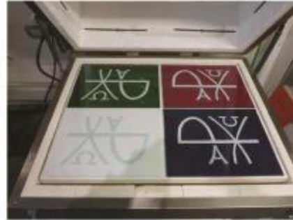
21. Gekleurde glaspanelen (liturgische symbolen) in de oven