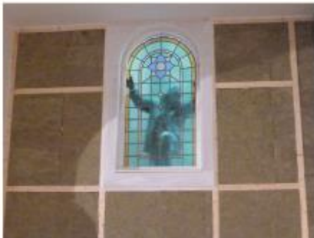
18. Het glas in lood wordt herplaatst