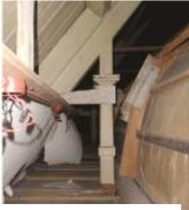
Historisch gewelf en kapconstructie, verstoep in 1954

In 1968 telt de gemeente 447 leden en wijkt uit naar de Gasthuiskerk.