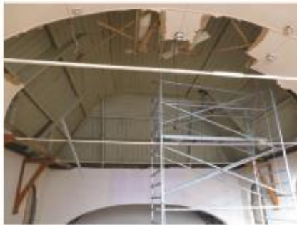
11. Het historische kerkgewelf komt weer in zicht, 2015