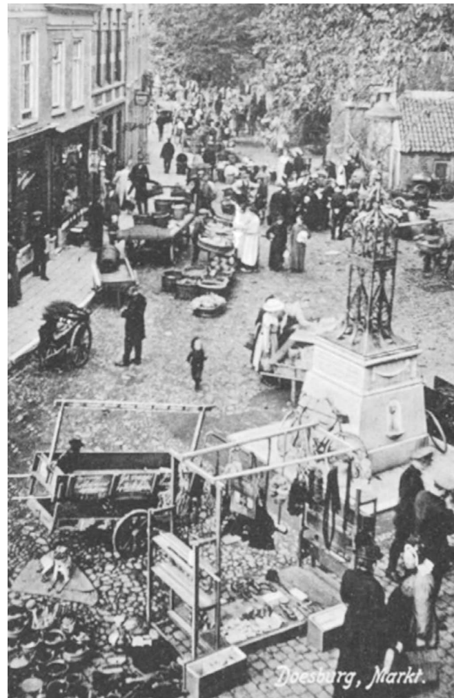
De Markt in vroeger tijden

Aan de achterzijde van het stadhuis werd de vismarkt gehouden; die naam is kortgeleden weer in ere hersteld. Doesburg had lange tijd zes markten per jaar voor dieren en overigens ook één kermis en een station der paardenposterij. Een natuurgetrouwe maquette bij de achtermuur