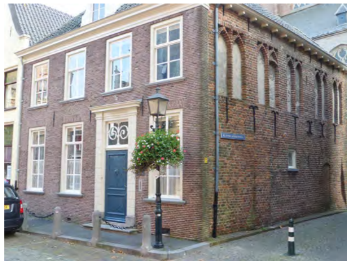
Roggestraat anno 2017