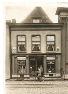
Foto van het winkelpand van de fa. Van den Bold. Zoon Aaldert op de fiets. Vader Willem kijkt toe. Op de etalageruit staat: Van den Bold Stoomkoffiebranderij. De foto is waarschijnlijk omstreeks 1910 genomen

Al heel vroeg moesten de kinderen van Willem van den Bold meewerken in het bedrijf van hun vader. Zo beschikken we over een foto van het bedrijf waarbij zoon Aaldert, die het bedrijf later zou overnemen, al op jonge leeftijd met een fiets met een mand voorop klaar staat om boodschappen rond te brengen bij de klanten in Doesburg. In 1943 werden de koffiebranderij-activiteiten wegens gebrek aan koffie beëindigd.