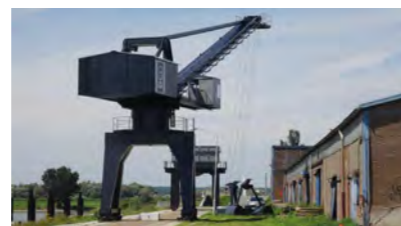
Kraan en trechter

De kraan en trechter bij de Turfhaven zijn in opdracht van de Gemeente Doesburg opgeknapt en zullen opgenomen worden in het renovatieplan van de GTW loods.