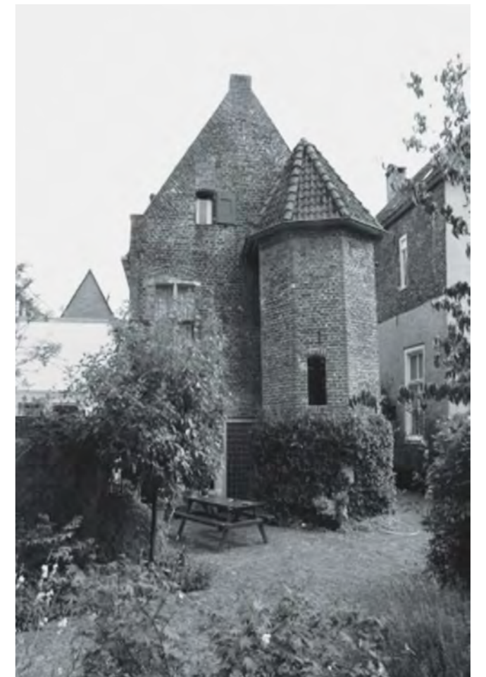
Gasthuisstraat 3, toren met spiltrap

die we ook Gasthuiskerk noemen. Er lag ook een kazerne achter en verderop een paar kloosters en een fraterhuis. Bij een recente opgraving naast de Gasthuiskerk vonden archeologen middeleeuwse munten uit Engeland en Zweden. Lang geleden handelde men hier al met het buitenland. De vondsten, ook de skeletten, zijn te zien in het museum De Roode Toeren.