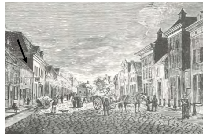
Koepoortstraat met links herberg de Beer

Terug naar de buitenlui. Die konden in nog veel meer herbergen terecht. Wij noemen het Heerenlogement in de Koepoortstraat (nummer 40). Daar aten de heren van Lennep en van Hogendorp kersen in de zomer van 1823. De vermoede reiziger kon ook terecht in herberg "De Beer", Koepoortstraat 46. Of meer chique, op nummer 1, bij het Hof Gelria, later gedegradeerd tot tramhalte en nu deel van het stadhuis. Het was gebouwd aan het eind van de 15 e eeuw. Het oudste bierhuis heet "de Waag" (al vanaf 1478), op de hoek van de Gasthuisstraat. De originele balansweegschaal hangt nog aan het plafond. In de Koepoortstraat woonde de gezeten burgerij. Bij voorbeeld op nummer 26 in "De Pauw", tussen 1450 en 1480 gebouwd, een huis met zeer afwisselende geschiedenis van deftige bewoning tot bierfabriek, bottelarij en ijsfabriek, loket van de tram en nu architectenbureau. Fraai gerestaureerd door de Vereniging Hendrick de Keijser.