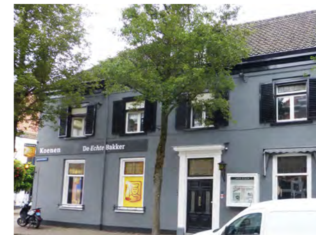
Ooipoortstraat 1 na renovatie