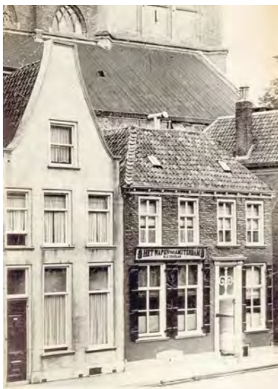
Roggestraat ca. 1890

zijgevel. Door latere verbouwingen en restauraties zijn helaas veel oorspronkelijke laatmiddeleeuwse onderdelen verloren gegaan, maar gelukkig is vooral aan de zijgevel en de achtergevel nog veel historisch metselwerk bewaard gebleven. Dit metselwerk is goed herkenbaar omdat gebruik gemaakt is van zogenaamde 'kloostermoppen' en gesinterde en geglazuurde koppen. Aan de achterzijde zijn, te midden van de latere wijzigingen, restanten bewaard gebleven van een zandstenen latei van een kruisvenster en van een bakstenen kloostervenster, zodat de oude gevelindeling herkenbaar is. Opvallend is de reeks gekoppelde blindvensters met de bakstenen spitsbogen in de zijgevel aan de Kleine Kerks-teeg. Deze zijn gevat in een rechthoekige nis. De achtervlakken van de nissen zijn gepleisterd waardoor de nissen duidelijker zichtbaar zijn. De functie van deze nissen is louter decoratief. In plaats van een vlakke eentonige zijwand kreeg deze zijgevel een levendig voorkomen waardoor het huis zich kon onderscheiden van omliggende panden. Het betreft hier dus geen later dichtgezette ramen. Alleen bij de tweede dubbele nis van links gezien is in de rechter spitsboog een horizontaal segmentboogje zichtbaar. Bouwhistorisch onderzoek heeft uitgewezen dat hier oorspronkelijk een vensteropening aanwezig was. Bijzonder aan deze zijgevel zijn ook de opvallende muurankers die verschillend van formaat en vorm zijn. De voorgevel bezat oorspronkelijk waarschijn-