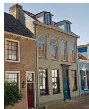
Korte Veerpoortstraat 3

Dit pand werd al in 2012 genomineerd vanwege de lichtopeningen in de voorgevel van dit winkelpand die zijn voorzien van een passende verflaag. Ditmaal betreft het de ombouw van winkel tot woonhuis met een aanpassing van de oorspronkelijke pui-lijst boven het winkelraam, die is doorgetrokken tot boven de ingang naar het bovenhuis. Als aanzicht wel in stijl en heel fraai gedaan, maar niet authentiek.