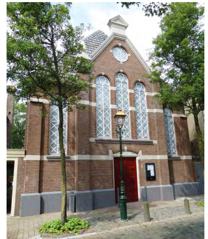
Ooipoortkerk in volle, gerestaureerde glorie

van het kerkinterieur, de enthousiaste meubelmaker Jasper Zwart maakt de meubels. Glasatelier Jevaba tekent voor de doopschaal en de kleurige antependia. De restauratie, die start in september 2015 wordt voltooid in april 2016. De hoofdvorm van het kerkgebouw is ongewijzigd gebleven. De indeling en afwerking van de kerk is geoptimaliseerd en aangepast aan hedendaags gebruik, zowel voor kerkdiensten als voor andere activiteiten. De stoelen staan in een intieme opstelling en bieden plaats aan 100 tot 125 personen. Het podium, entree, garderobe, keuken en toiletten zijn verruimd. Vloeren, plafonds en ramen zijn geïsoleerd. De akoestiek is verbeterd. De technische installaties zijn up to date gemaakt inclusief de audiovisuele installatie en gratis internet voor kerkbezoekers. Historische materialen en constructies zijn hersteld zoals; bakstenen gevels met glas-in-lood ramen, gietijzeren goten,