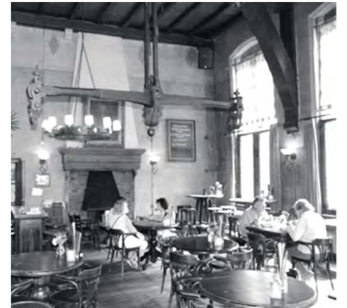
De weegschaal in de Waag

Aan de achterzijde van nummer 3 zien we een kleine middeleeuwse toren met originele wenteltrap, ooit onderdeel van het winterverblijf van de adellijke bewoners van het kasteel Middachten. Buitenlui?? Het huis heet De twee Salmen, maar is hier vooral bekend als voormalige meubeltoonzaal. De straat laat meer interessante details zien, maar we richten ons nu op hét vroegere opvangcentrum voor buitenlui: het Gasthuis, met de nog bestaande Antoniuskapel,