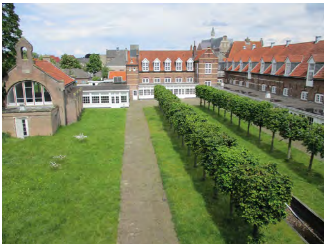
Fraai uitzicht op het Arsenaal en kruithuis

De weg werd vervolgd naar het Arsenaal (niet zo mooi als in Doesburg) over de kat (een aarden verhoging die de ka-