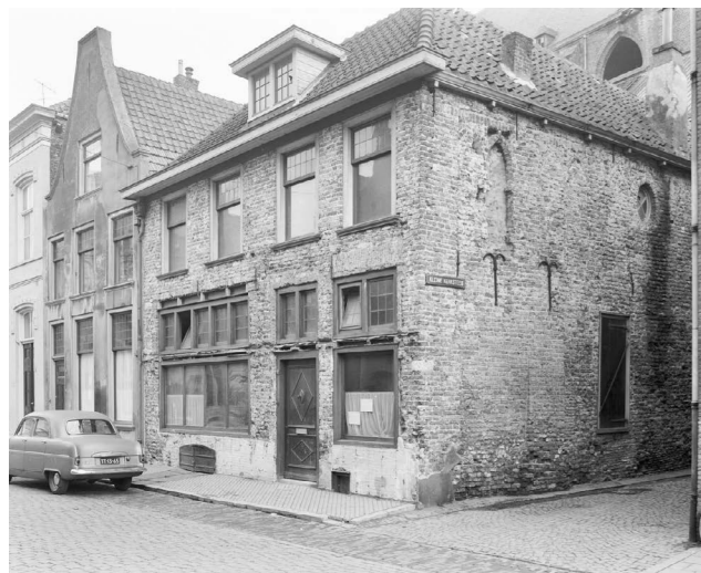
Huis vóór restauratie 1964-1965

zijgevel. Door latere verbouwingen en restauraties zijn helaas veel oorspronkelijke laatmiddeleeuwse onderdelen verloren gegaan, maar gelukkig is vooral aan de zijgevel en de achtergevel nog veel historisch metselwerk bewaard gebleven. Dit metselwerk is goed herkenbaar omdat gebruik gemaakt is van zogenaamde 'kloostermoppen' en gesinterde en geglazuurde koppen. Aan de achterzijde zijn, te midden van de latere wijzigingen, restanten bewaard gebleven van een zandstenen latei van een kruisvenster en van een bakstenen kloostervenster, zodat de oude gevelindeling herkenbaar is. Opvallend is de reeks gekoppelde blindvensters met de bakstenen spitsbogen in de zijgevel aan de Kleine Kerks-teeg. Deze zijn gevat in een rechthoekige nis. De achtervlakken van de nissen zijn gepleisterd waardoor de nissen duidelijker zichtbaar zijn. De functie van deze nissen is louter decoratief. In plaats van een vlakke eentonige zijwand kreeg deze zijgevel een levendig voorkomen waardoor het huis zich kon onderscheiden van omliggende panden. Het betreft hier dus geen later dichtgezette ramen. Alleen bij de tweede dubbele nis van links gezien is in de rechter spitsboog een horizontaal segmentboogje zichtbaar. Bouwhistorisch onderzoek heeft uitgewezen dat hier oorspronkelijk een vensteropening aanwezig was. Bijzonder aan deze zijgevel zijn ook de opvallende muurankers die verschillend van formaat en vorm zijn. De voorgevel bezat oorspronkelijk waarschijn-