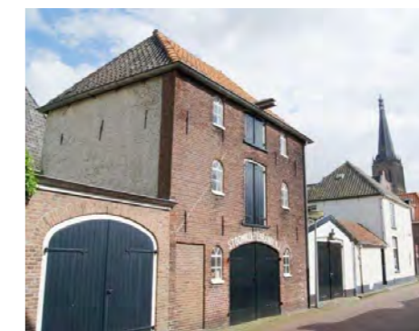
Het pand aan de Heilige Geeststeeg met het kenmerkende opschrift

In dit artikel de resultaten van het gevelschrift aan de Stoomkoffiebranderij aan de Heilige Geeststeeg.