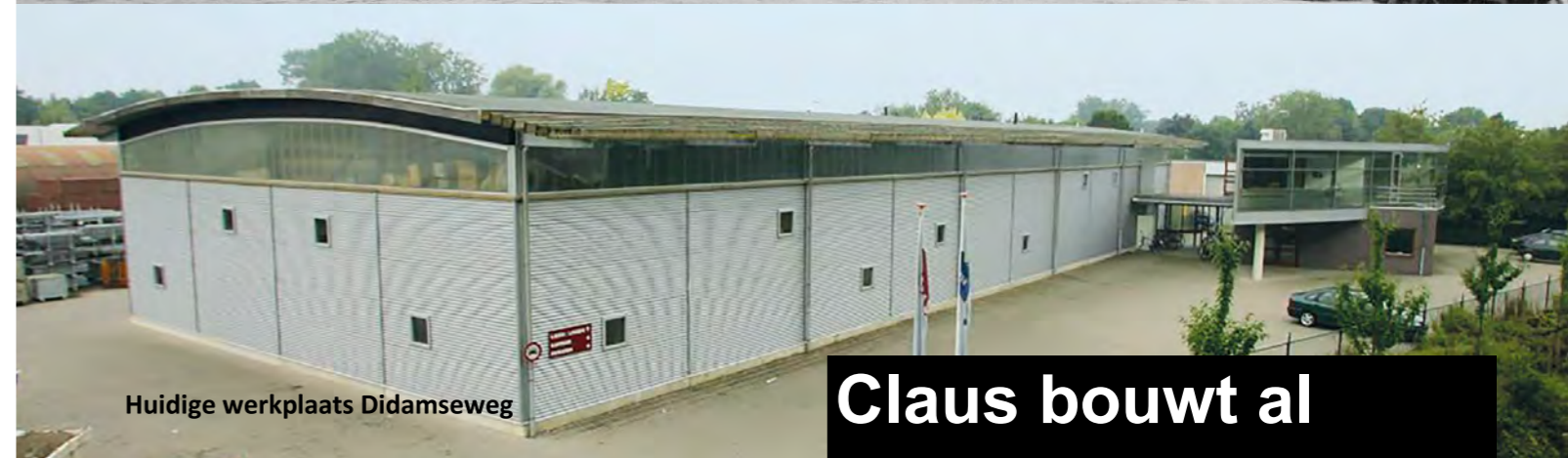
Huidige werkplaats Didamseweg

Claus bouwt al meer dan honderd jaar in Doesburg en omstreken.