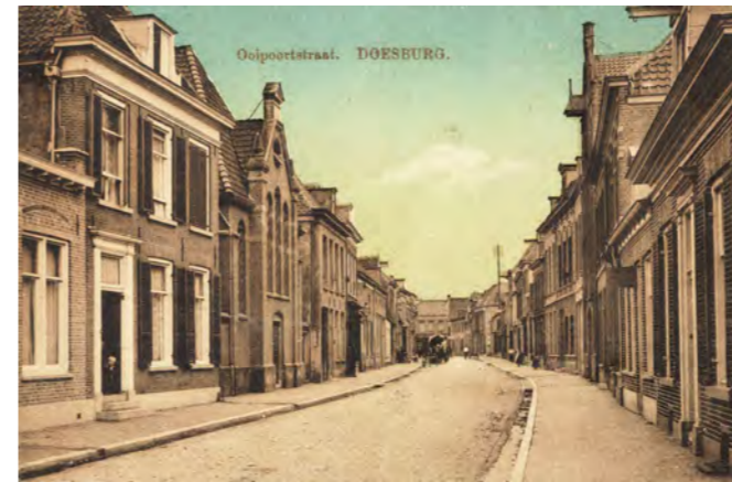
Ooipoortstraat met kerk