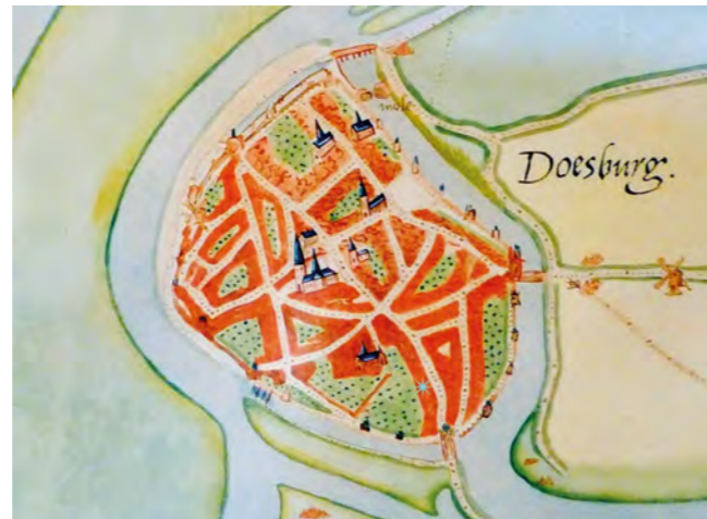
Stadsplattegrond van Doesburg van Jacob van Deventer

Door de kerstening vanuit Rome ontstaan in de 7e eeuw kerkgebouwen in ons land. Ook in Doesburg worden in de middeleeuwen kerken en kloosters gebouwd. Op een stadsplattegrond van Jacob van Deventer (1565) zijn die mooi te zien.