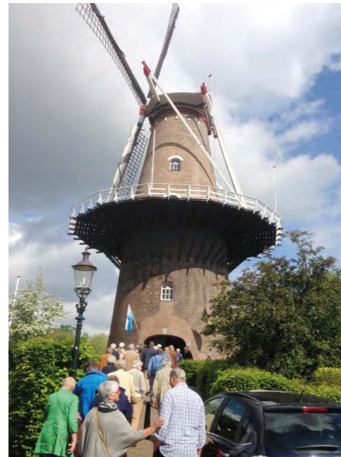
Molen van Ravenstein

Een zeer grote mooie kast met zeer veel laden stond te pronken in de brouwerij. Die nodigde uit om er even in te neuzen. En ja hoor, volgens mij werd er zelfs iets van snoep in ontdekt (het schoolreisje gehalte). Voor verdere info kijk op www.molenvanravenstein.nl en www.stadsbouwerij.nl .