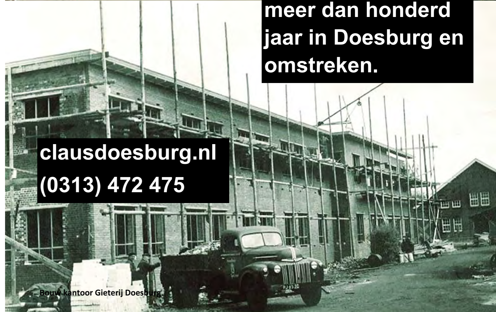
Bouw kantoor Gieterij Doesburg

Claus bouwt al meer dan honderd jaar in Doesburg en omstreken.