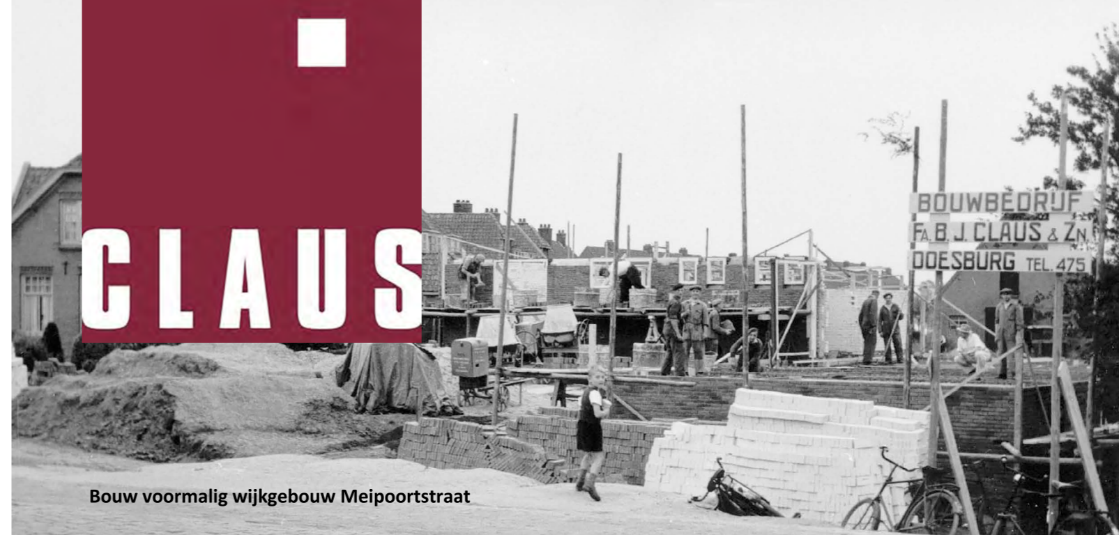
Bouw voormalig wijkgebouw Meipoortstraat