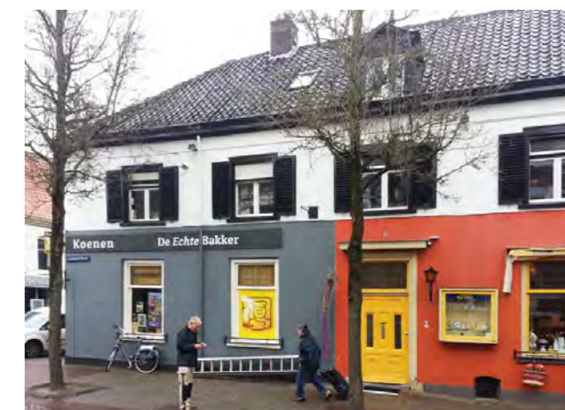
Ooipoortstraat 1 voor renovatie

Aan dhr. Bert Stulp, eigenaar van het pand Meipoortstraat 2 / Ooipoortstraat 1 is in maart 2017 een subsidiebedrag toegekend van € 615 voor de vernieuwing van de deuroplijsting van de voormalige wereldwinkel aan de kant van de Ooipoortstraat. Deze deuroplijsting dateerde hoogstwaarschijnlijk uit 1906 toen ook de glas-in-loodramen beneden werden aangebracht en het bovenlicht boven de deur